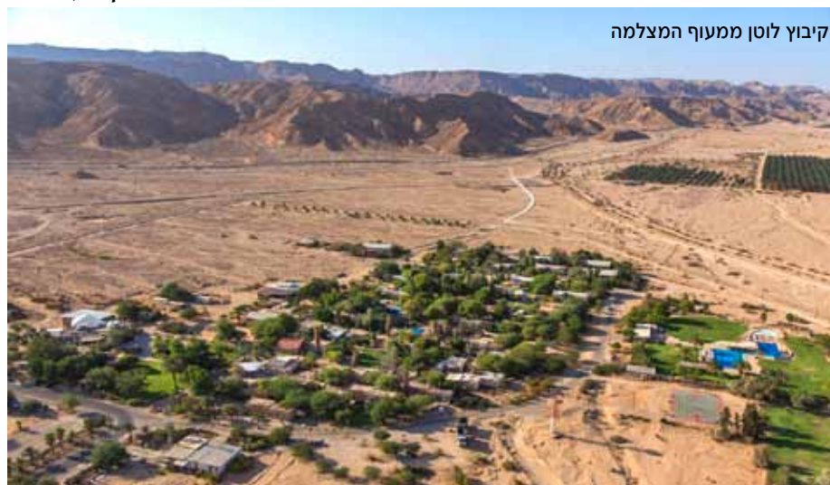
קיבוץ לוטן ממעוף המצלמה